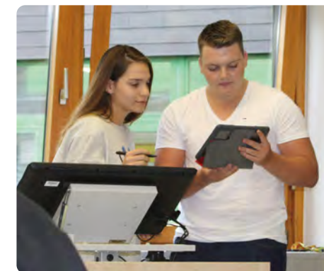
Kaufleute im E-Commerce