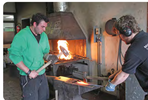
Herstellung eines geschmiedeten Geländers (Metallgestalter)

SCHULABSCHLUSS Der Besuch der Fachklassen des dualen Systems der Berufsausbildung endet mit dem Berufschulabschluss, wenn die Leistungen am Ende des Bildungsganges den Anforderungen entsprechen. Der Berufsabschluss wird nach erfolgreicher Prüfung durch die jeweilige nach dem Berufsbildungsgesetz (BBiG) oder der Handwerksordnung (HwO) zuständigen Stelle vergeben.