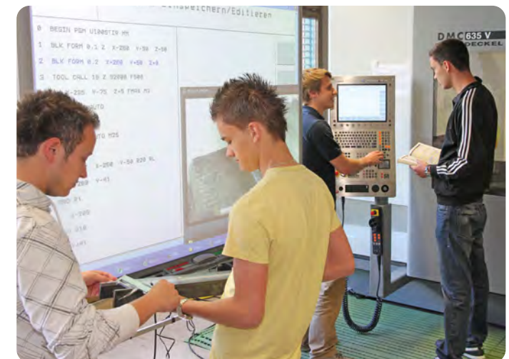
Optimierung eines CNC Fräsprogrammes