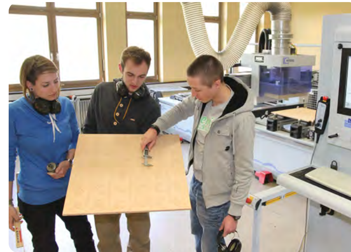
Überprüfung von Gravurmaßen

SCHULABSCHLUSS Mit der in diesem Bildungsgang erworbenen Fachhochschulreife kann ein Fachhochschulstudium begonnen werden. Darüber hinaus haben sich die Qualifikationen für eine Berufsausbildung erhöht.